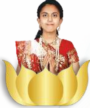
મુમુક્ષુ ચાૃૃીબેન સંઘવી