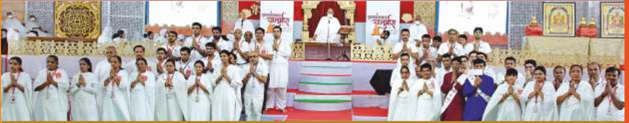
Arham Yuva Seva group and LnL didis Kolkatta