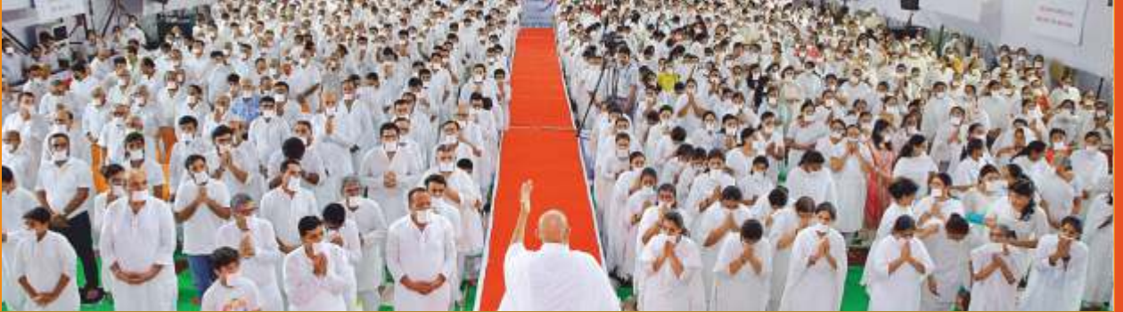
Bhaviks taking Alochana and taking oath of shravaks 12 vrat

Every celebration gave us a message that one could imbibe for positive living.