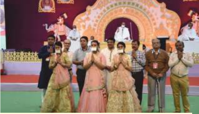
Sangh Sanman and Bhakti

“છોડી શકું ના હું આ સંસાર, આવી શકું ના તારી સાથ”